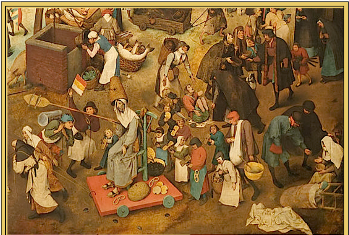
La lutte entre Carnaval et Carême (Brueghel, 1559). Le personnage personnifiant le jeûne est entouré de bretzels...

La clé se trouve sur le tableau de Brueghel l'Ancien, La lutte entre Carnaval et Carême (1559). Ce tableau illustre la transition entre deux temps spirituels de l'année, le Mardi Gras et le Mercredi des Cendres, entre la période où l'on peut manger de la viande, et la période de jeûne, le Carême, qui permettait de se purifier en préparation de la fête de Pâques. Pendant cette période maigre, la corporation des bouchers