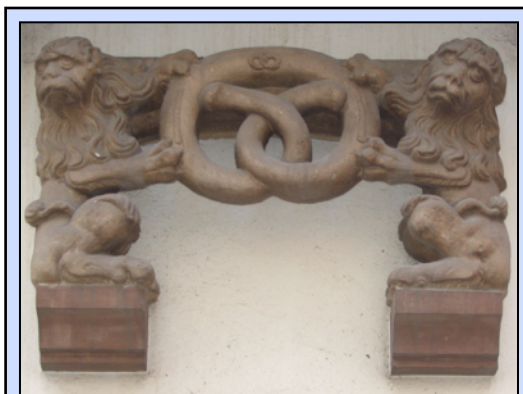
Armes de l'ancienne corporation des boulangers. Au Coin Brûlé.