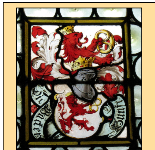
Armes de la corporation, au Struss avec un autre modèle de bretzel